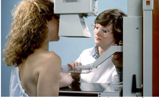
میموگرافی اسکریننگ تک رسائی کیسے ہو؟

نوٹ: اگر آپ کوئی علامت مخصوص کریں مثال کے طور پر آپکی بریسٹ میں لمپ ہے، تو آپ کا ڈاکٹر آپکو تشخیصی میموگرام کے لئے بھیج سکتا ہے۔